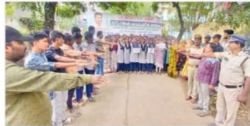
కడియంలో ప్రతిజ్ఞ చేస్తున్న విద్యార్థులు, పోలీసులు