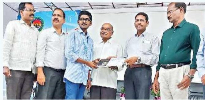
ఆర్ట్స్ కళాశాలలో విజేతకు బహుమతి ప్రదానం