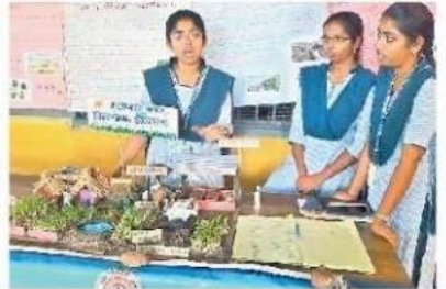
ఎకో ఫ్రెండ్లీ ఫార్మింగ్ విధానాన్ని వివరిస్తూ..