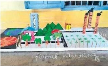
గ్లోబల్ వార్మింగ్ ప్రాజెక్టు ప్రదర్శన