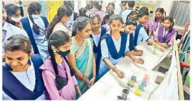
ఆర్ట్స్ కళాశాలలో సైన్స్ ప్రదర్శన తిలకిస్తున్న విద్యార్థులు