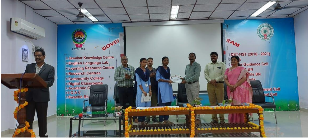
Images: Prizes and certificates distribution.