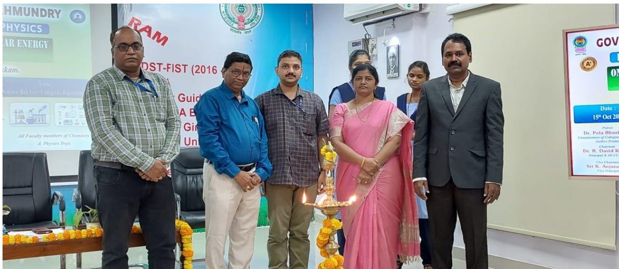
Image: Jyoti prajvalan.