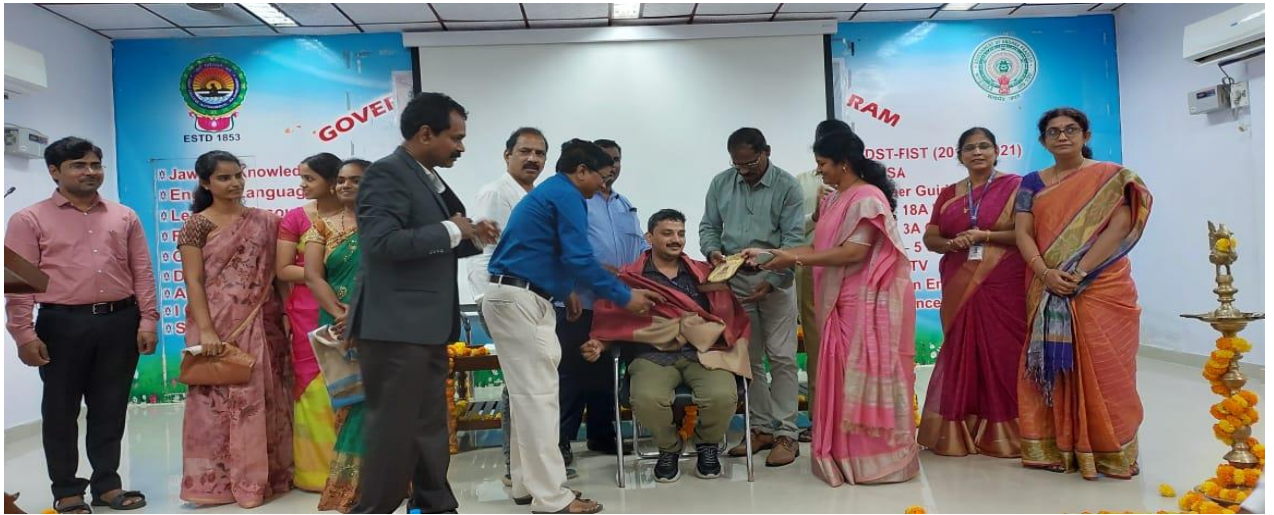
Image: Felicitating the guests.