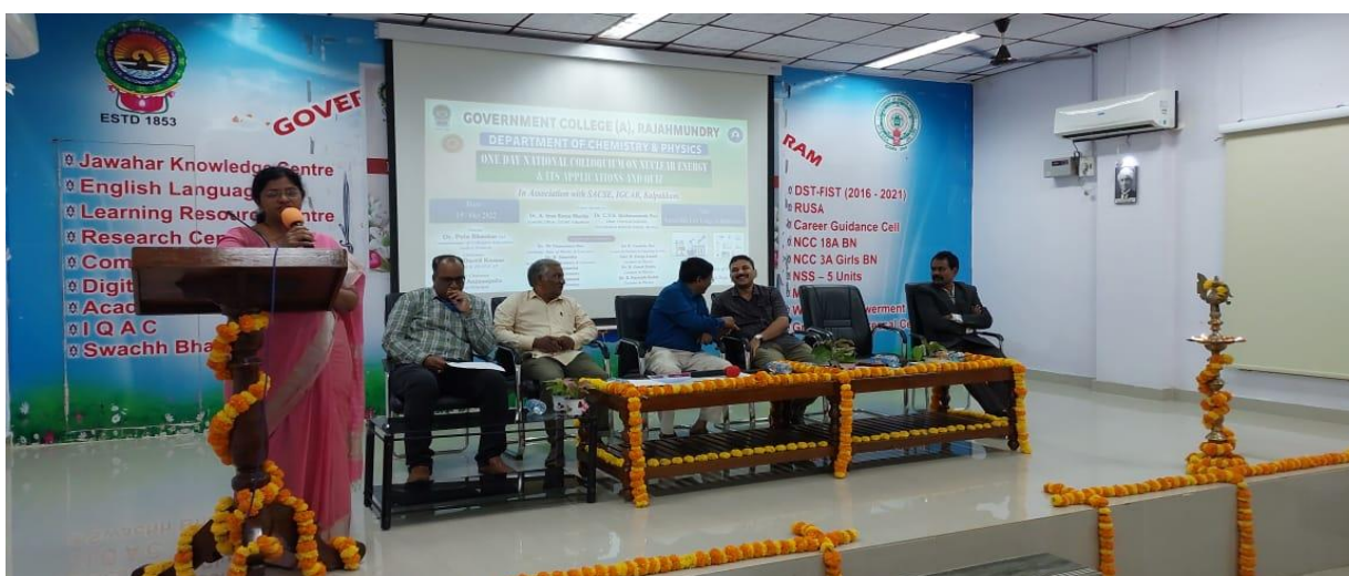
Image: Keynote address by convenors.