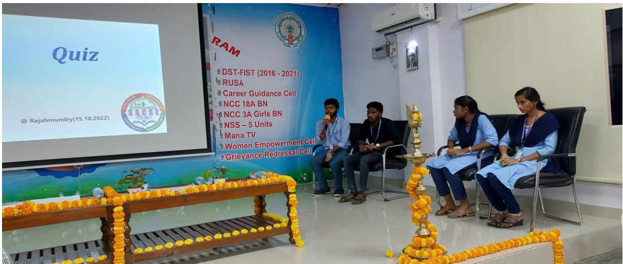
Its quiz time!