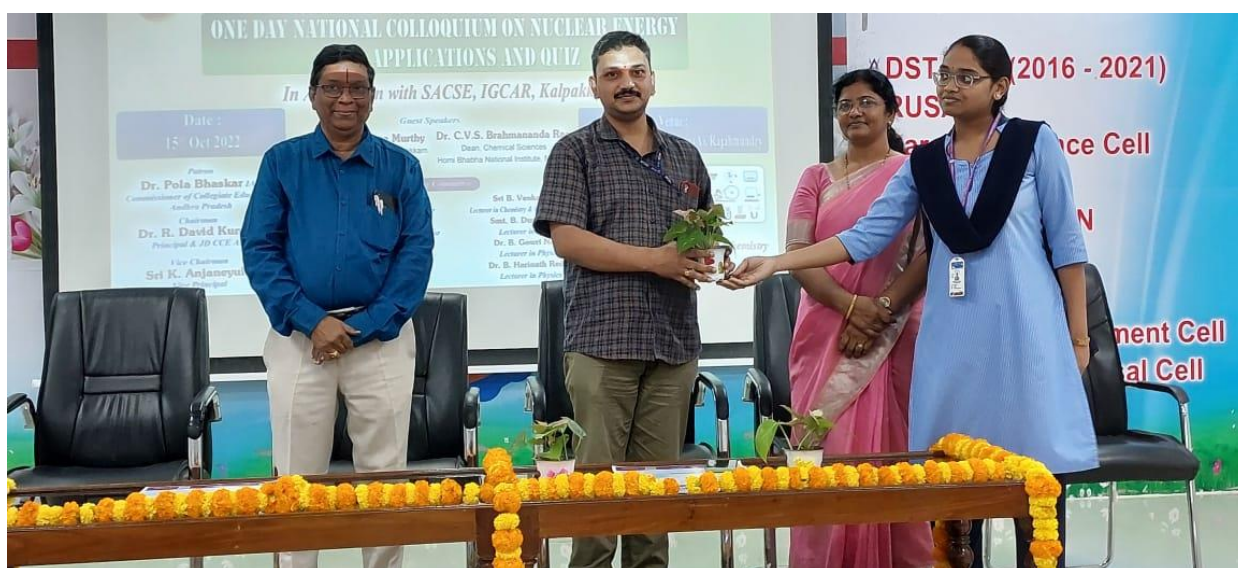
Welcoming the distinguished guests.