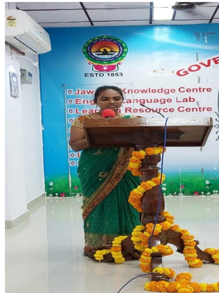
Images: Introducing the distinguished guests.